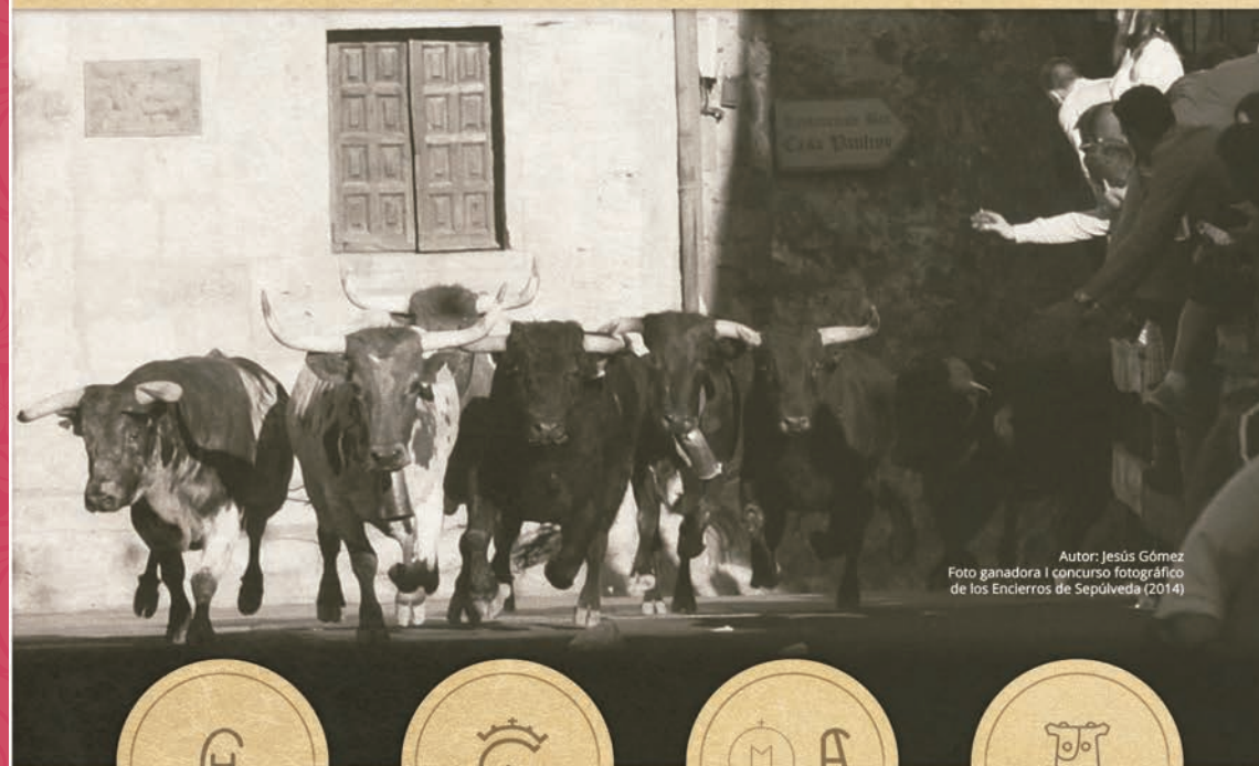
Autor: Jesús Gómez Foto ganadora I concurso fotográfico de los Encierros de Sepúlveda (2014)

LOS DÍAS 28, 29, 30 A LAS 10:30H Y 31 DE AGOSTO A LAS 12:00H